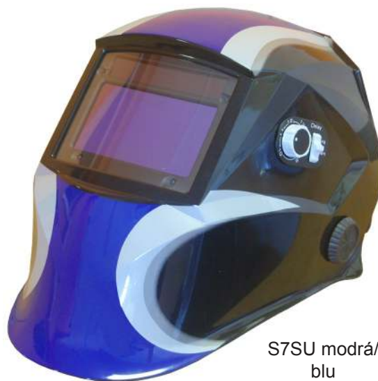
S7SU modrá/ blu

Vhodné i pro svařování metodou TIG Suitable for TIG low amperage welding