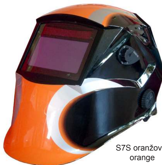
S7S oranžová/ orange